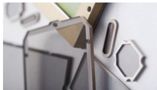
Szyby szczelne EMC