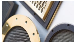
Ekranowane panele wentylacyjne