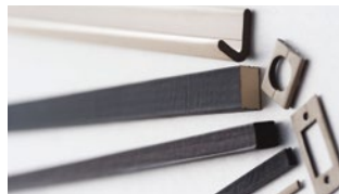
Uszczelki EMC piankowe