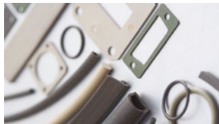
Uszczelki EMC elastomerowe

Nasza strategia oraz proces zarządzania skierowane są na zadowolenie naszych klientów z produktów oraz rozwiązań technologicznych, które dostarczamy. Współpracujemy z wiodącymi europejskimi producentami i naszymi działaniami zwiększamy popularność naszych marek na polskim rynku.